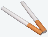
말아 피는 담배 및 담뱃갑